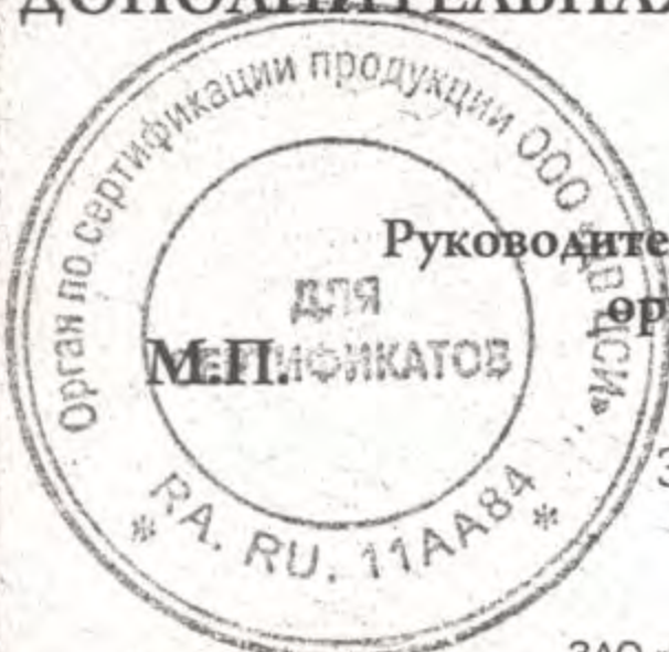
схема сертификации За

Руководитель (заместитель руководителя) органа по сертификации